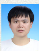
金城工程师 新誉集团有限公司